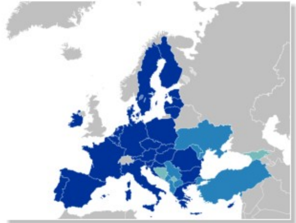
Die Mitgliedsstaaten der Europäischen Union (dunkelblau), offizielle Beitrittskandidaten (hellblau), potentielle Beitrittskandidaten (türkis)

Nachdem die ukrainische Regierung am 28. Februar und die Republik Moldau am 3. März Anträge zum EU-Beitritt gestellt hatten, entschied der Europäische Rat in Brüssel am 23. Juni, beiden Ländern den Status von Beitrittskandidaten zuzuerkennen [3]. Dies verwundert um so mehr, da sich die Ukraine aktuell in einem Verteidigungskrieg befindet, sich ihre Regionen Donezk und Lugansk für unabhängig erklärt haben und Russland offensichtlich in einigen Gebieten Referenden für einen Anschluss vorbereitet [4]. Mit Transnistrien besitzt auch die Republik Moldau einen von Moskau instrumentalisierten Sezessionskonflikt im eigenen Land [5]. Es besteht noch immer die Gefahr, dass Moldau ebenfalls in den Krieg hineingezogen wird.